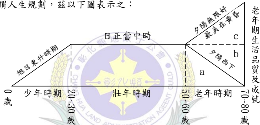
圖 1：懂得生涯規劃且執行非常成功的人生，就完全等於少壯「知努力」，老大就會「免悲傷」之人生軌跡示意圖。